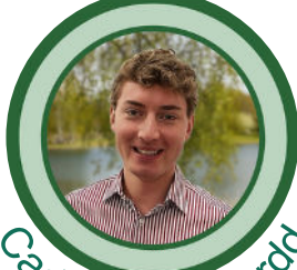
Cadeirydd y Bwrdd