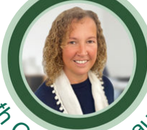
Pennaeth Gwasanaethau Mewnol