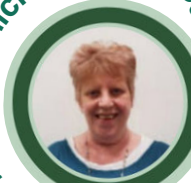
Pennaeth Datblygu'r Trydydd Sector