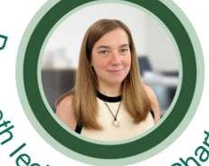
Pennaeth Iechyd, Lles a Phartneriaeth